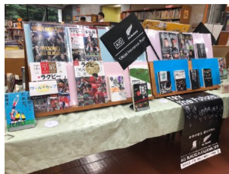
▲柏市は、ラグビーW杯に向けたオールブラックスの事前キャンプ地となりました。これにあわせ、ラグビーやニュージーランドの歴史・文化を紹介しました。(9月)