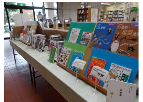
▲第62回全日本吹奏楽コンクールに東関東支部代表として酒井根中と市立柏高校が出場しました。この活躍を紹介するとともに、吹奏楽関連の本を展示しました。(10月)