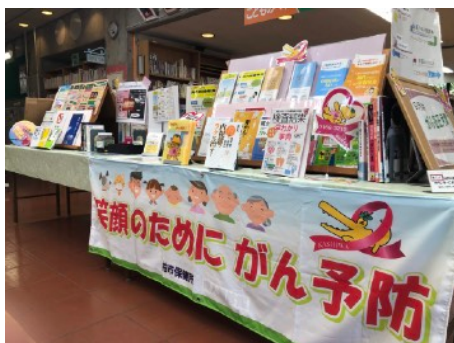
▲柏市保健所の協力により、たばこのタールと乳がんの模型の展示や各種パンフレットを配布し、日頃の生活習慣の見直しやがん予防の啓発を行いました。(9月)