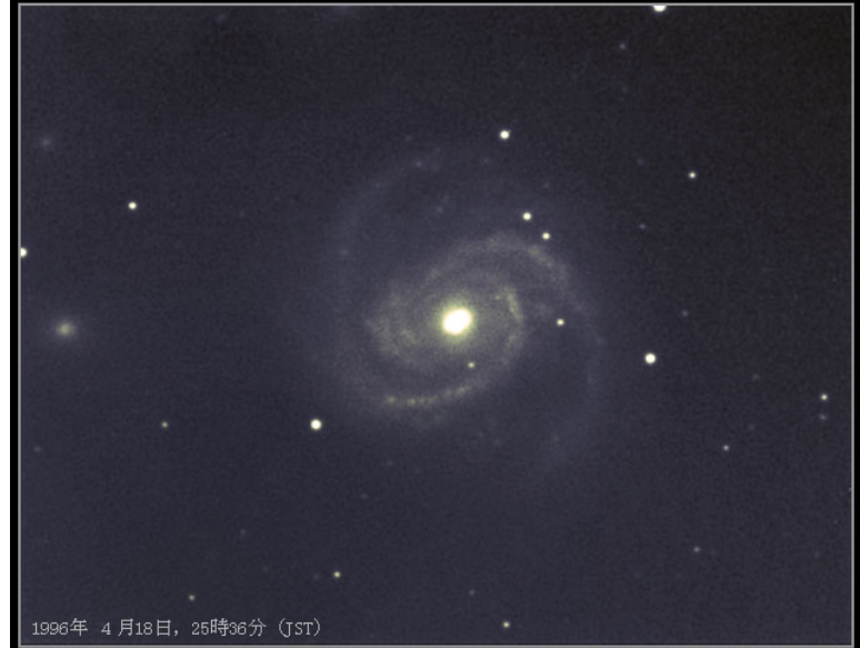
1996年 4月18日, 25時36分 (JST)